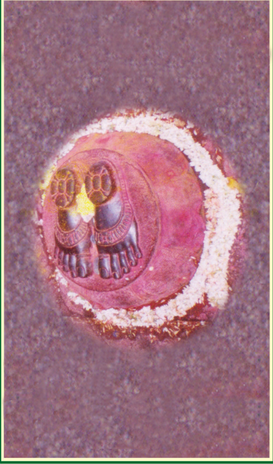
శ్రీవారి పాదాలు - నారాయణగిరి (తిరుమల)